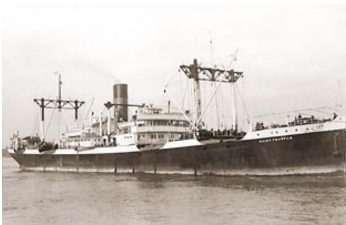
Una imatge original dels anys trenta del Saint Prosper .

Aquestes imatges en tres dimensions determinen fets tan rellevants com ara que